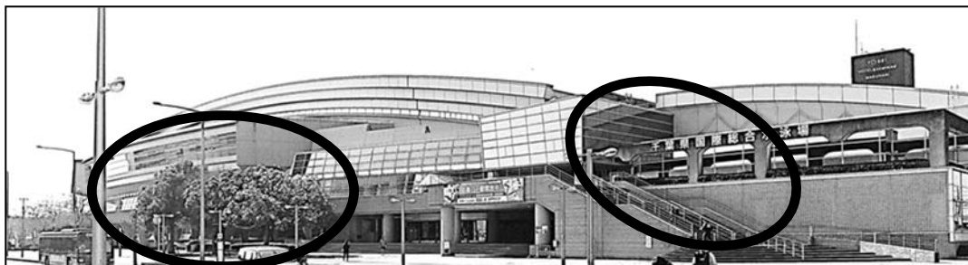
1F南側入口 (街路樹の裏)