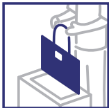
服飾雑貨 バッグ(エナメル含む)、 タオル、靴下など