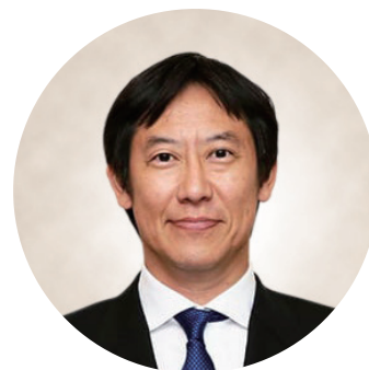
公益財団法人 日本水泳連盟 会長 鈴木 大地