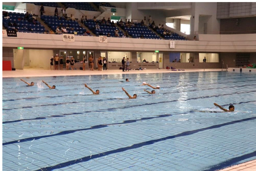
④「拔手雁行」 水任流・水任流保存会