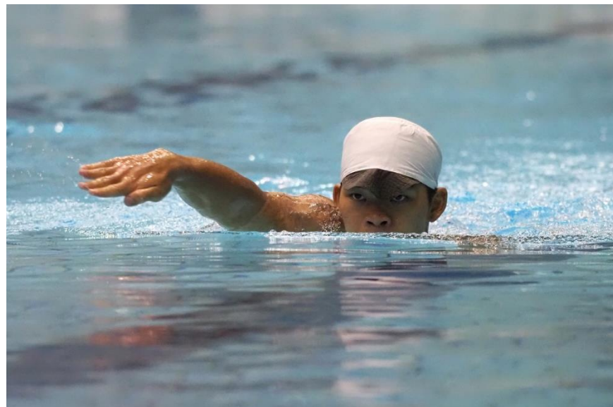
小池流・抜髻正体