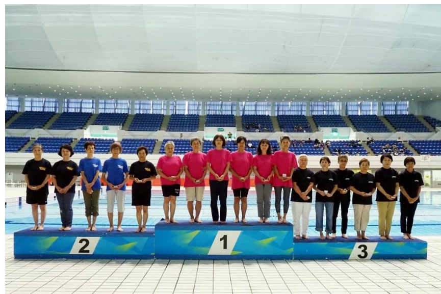
団体泳法競技シニアクラス