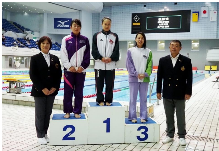
横泳ぎ競泳・女子