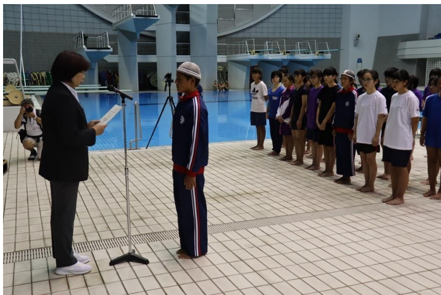
泳法競技ジュニアクラス・男子