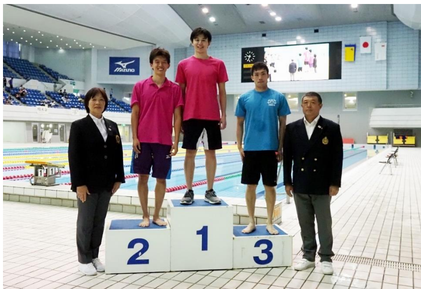
横泳ぎ競泳・男子