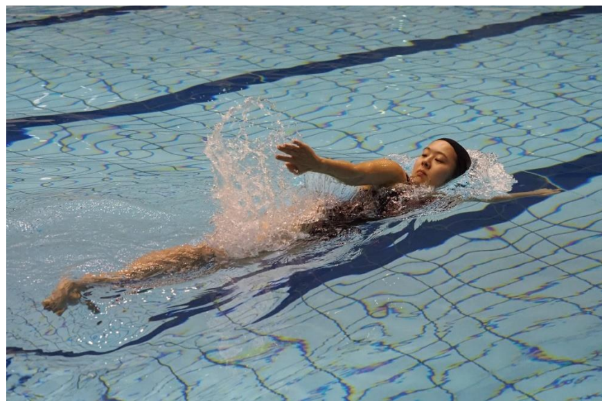
水府流太田派・片抜手二重伸