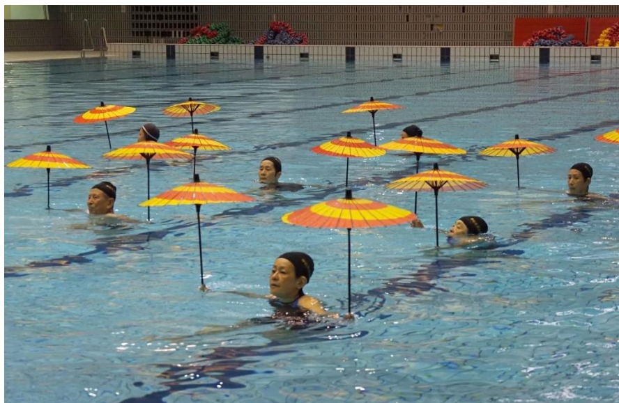
①「諸手日傘」 神伝流・千葉県国際総合水泳場日本泳法教室