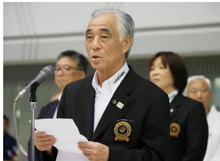
日本水泳連盟 青木会長挨拶