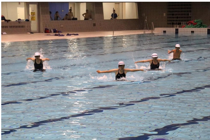
⑦「群龍」 岩倉流和歌山水練学校