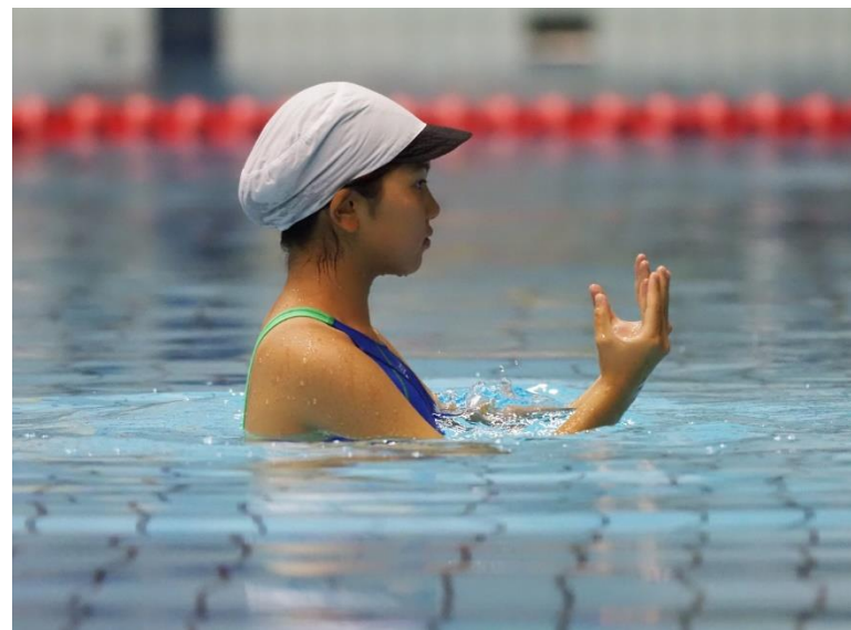
泳法競技ジュニアクラス(小池流・立游正体)