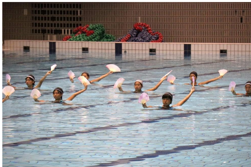
②「扇水鳥」 小池流・芦屋水練学校