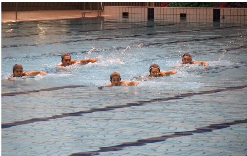
⑤「片手抜雁行・奇天烈雁行」 神伝流・瑞穂会