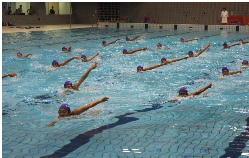
⑥「大抜手雁行」 水府流太田派連絡会