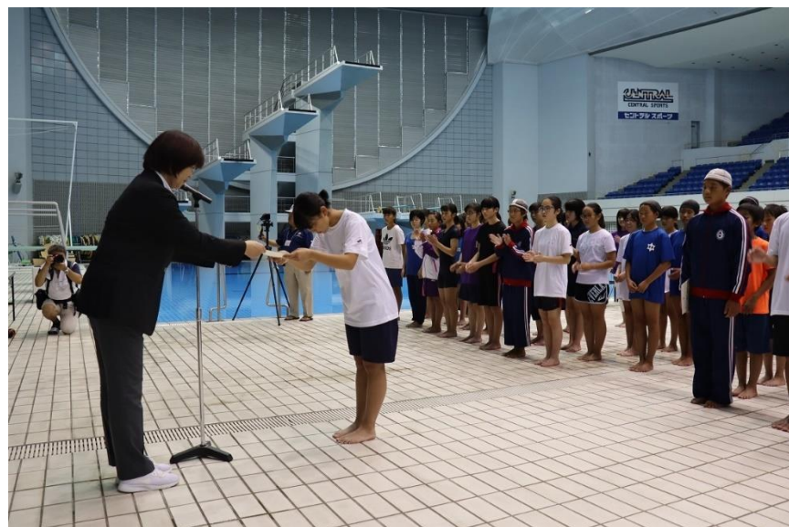
泳法競技ジュニアクラス・女子