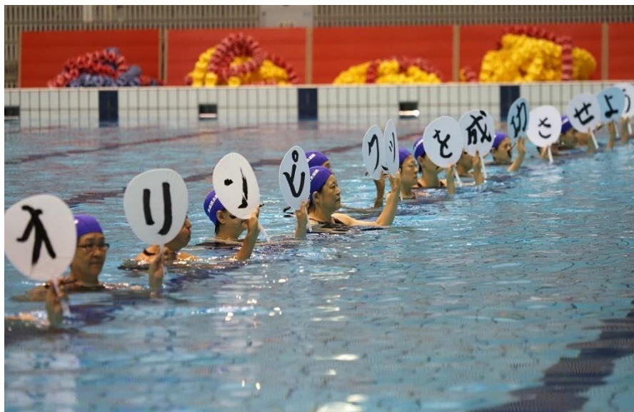
③「水書」 水府流太田派・水府流太田派連絡会